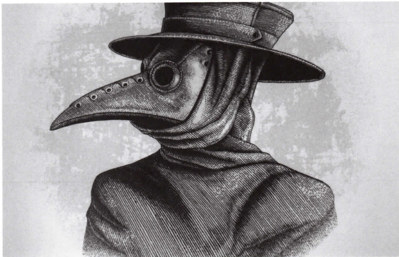
Médecin de peste (dessin à la main, gravure) — Memoring Editions

20 Minutes avec Statista | 🕒 Publié le 07/01/22 à 17h08 — Mis à jour le 10/01/22 à 12h17